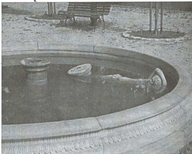
FONTANNA W PARKU MIEJSKIM W WĘGLIŃCU 27.06.2008 R.